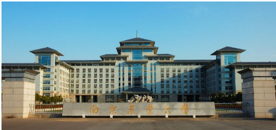
南京农业大学逸夫楼广场

学校获教育部、国家计划发展委员会批准设立国家生命科学与技术人才培养基地(简称生命科学与技术基地班)、国家理科基础科学研究与教学人才培养基地(简称生物学基地班)。2014 年生命科学