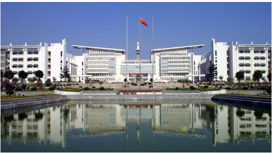
南京师范大学仙林校区敬文图书馆

特殊培养计划。英才计划实行导师组负责制,导师组为学生制定个性化培养方案。学生可在导师的指导下修读课程并参与科研项目。在项目进行期间可赴国内“985”高校、国内知名科研院所、海外高水平大学、研究机构留学或游学。另外,英才计划学生享有“保研”的优先权。