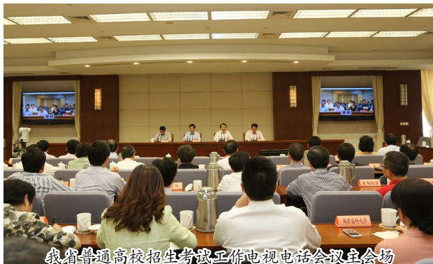
我省普通高校招生考试工作电视电话会议主会场

省高校招生委员会主任、委员，省教育厅、省教育考试院负责同志以及在宁高校分管招生工作负责同志在省主会场