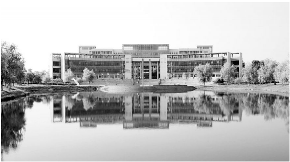
南京工程学院学海湾

南京工程学院是一所江苏省所属的公办全日制普通本科高校,具有本科学生的教育培养资格及相应的学位授予权。经过近百年的办学历程,学校已成为一所以工学为主的高等工程应用型本科院校,学科专业涵盖工学、经济学、管理学、文学、理学、法学等。