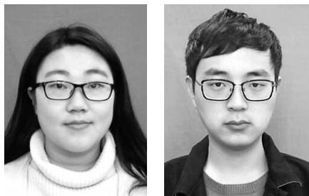
图 3: 报名阶段身份验证平板实现对考生人像照片标准采集检测

(2) 采集人像照片时将自动进行符合 ISO 三大标准的检测处理, 照片质量符合制证级采集, 采集的照片可以应用于后续考生准考证的制作。这一应用有效的取代了传统通过电脑、摄像头等设备组合进行考生的人像照片采集, 有效的提高了考生报名信息的采集效率, 同时在源头保障了考生的身份真实性。