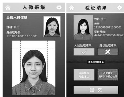
图 2:报名阶段人像采集及身份验证

采集人像照片时自动进行符合 ISO 三大标准的检测处理,照片质量符合制证级采集,采集的照片可充分应用于后续考生准考证的制作。