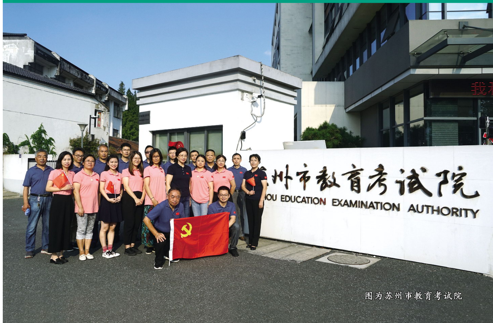
图为苏州市教育考试院